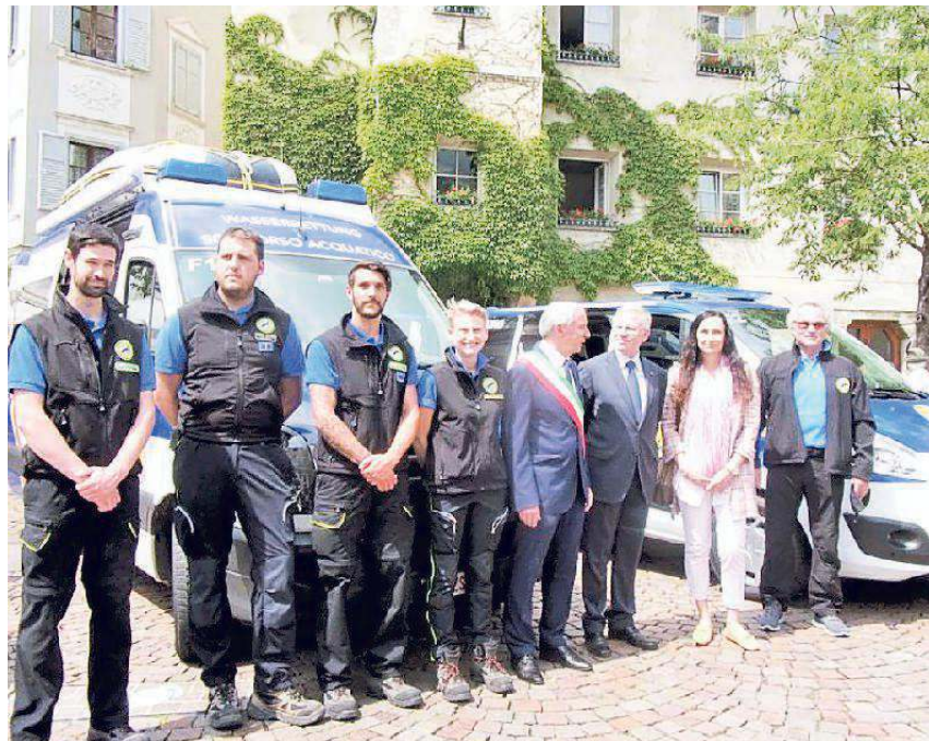
Le autorità con gli uomini del Soccorso acquatico