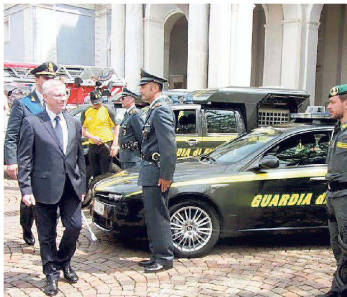
Il prefetto Cusumano saluta gli uomini della Guardia di finanza

A corteo e alzabandiera in piazza Duomo ha assistito il nuovo prefetto Cusumano. Dopo il saluto del vicesindaco Del Piero, la presentazione di uomini e mezzi