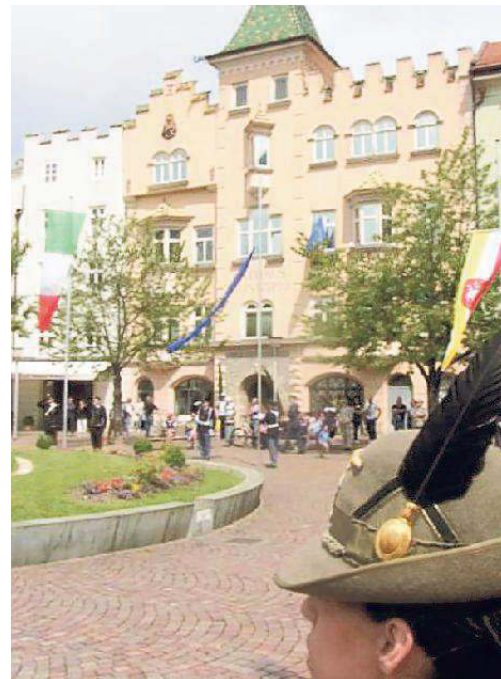
L'alzabandiera in piazza Duomo