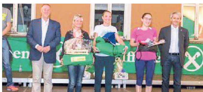
La premiazione della gara femminile