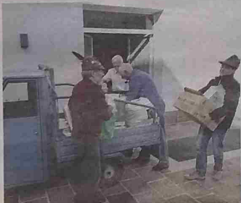
Fervono i preparativi: per la sezione Ana di Bressanone il lavoro in questi mesi non è certo mancato

Nel frattempo, nei giorni scorsi un discreto successo ha