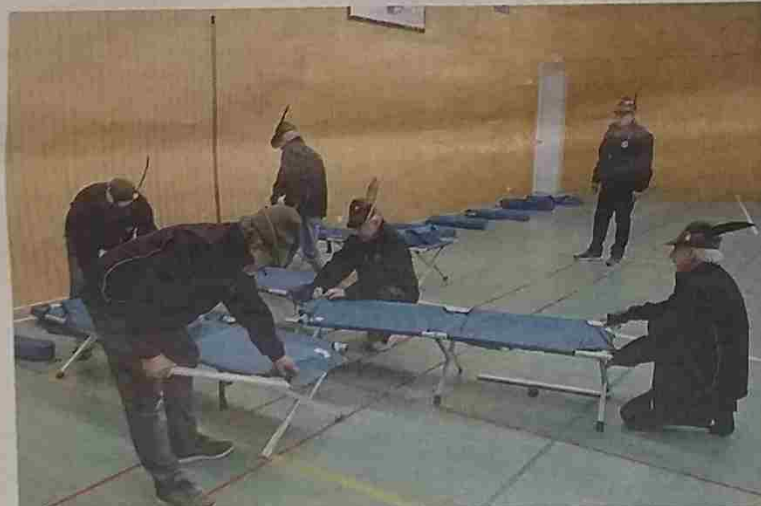
La preparazione delle brande nelle palestre per ospitare i cori che allieteranno la festa

avuto la mostra allestita presso il comando della Tridentina in viale Mozart, che ogni giorno riesce a richiamare sempre più curiosi ed ora ha aperto i battenti anche alle